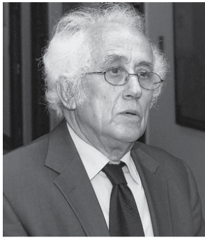
Ηλίας Π. Γεωργιάκης Αναδημοσίευση από το ΜΥ ΛΕΥΚΑΔΑ

Υπήρξε πρόεδρος του Δικηγορικού Συλλόγου Αθηνών για δύο θητείες καθώς και μέλος της Αρχής Προστασίας Δεδομένων Προσωπικού Χαρακτήρα. Στις 17 Μαΐου 2012 διορίστηκε υπηρεσιακός Υπουργός Εργασίας και Κοινωνικής Ασφάλισης στην Κυβέρνηση Πικραμμένου.