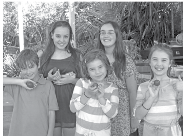
Τα εγγόνια του Προέδρου Σπύρου Ρομποτή επισκέπτονται πάλι φέτος την Ελλάδα και την Λευκάδα με την οποία είναι ερωτευμένα.