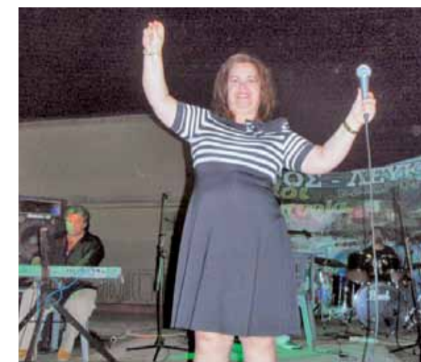
τραγουδίστριας Έφης Θώδη. Όλοι οι παρευρισκόμενοι απόλαυσαν την μουσική βραδιά με χορό και τραγούδι.

Το Σάββατο το βράδυ οι εκδηλώσεις ολοκληρώθηκαν με παραδοσιακή μουσική με τη φωνή της γνωστής