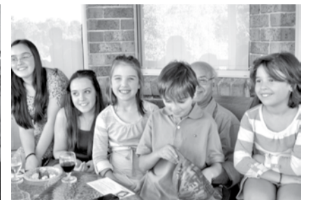
Τα εγγόνια του Προέδρου Σπύρου Ρομποτή επισκέπτονται πάλι φέτος την Ελλάδα και την Λευκάδα με την οποία είναι ερωτευμένα.