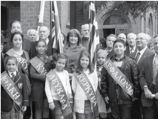
Έξω από τον Ευαγγελισμό μετά τον εκκλησιασμό, με τα παιδιά, την Γενική πρόξενο της Ελλάδας και προέδρους και μέλη της Επτανησιακής Ομοσπονδίας

Την Κυριακή 20 Μαΐου 2012 τελέστηκε εκ μέρους της Επτανησιακής Ομοσπονδίας Μελβούρνης, στην πρώτη εκκλησία της Μελβούρνης Ευαγγελισμός της Θεοτόκου, επιμνημόσυνο δοξολογία και αρτοκλασία για την 148 επέτειο της Ένωσης των Ιονίων νησιών με την Ελλάδα. Ακολούθησε πολιτιστική εκδήλωση στο Κεφαλλονίτικο σπίτι, που είχαν την προεδρία και στο τέλος έγινε η παράδοση της προεδρίας στους Ζακυνθινούς για το 2013.