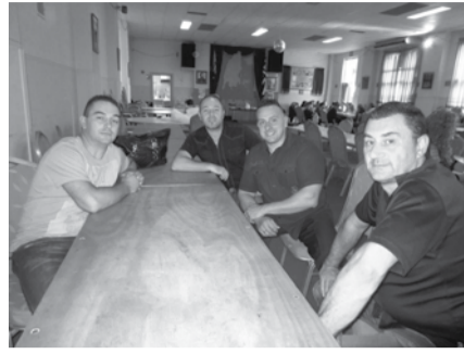
Νέες γενιές Αγιοπετρίτοπουλων στη Μελβούρνη Αυστραλίας. Αγόρια, κορίτσια, νύφες και εγγόνια