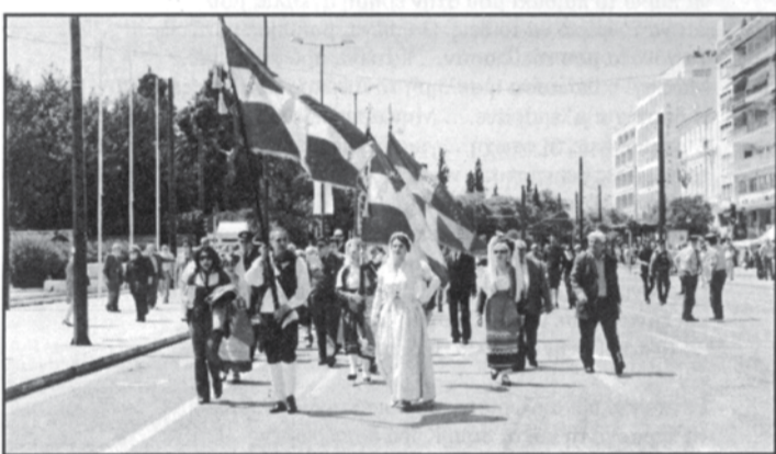
Από την 148 Επέτειο της Ένωσης της Επτανήσου με την Ελλάδα 1864-2012, 20/05/2012